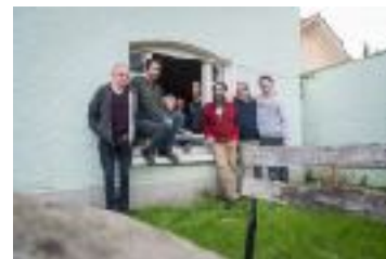
Les membres fondateurs

Présentation du collectif : L'association a été créée en 2016 à l'initiative de 7 photographes désireux de monter un collectif autour de la création visuelle. Une démarche qui associe au travail photographique des valeurs de partage et de solidarité