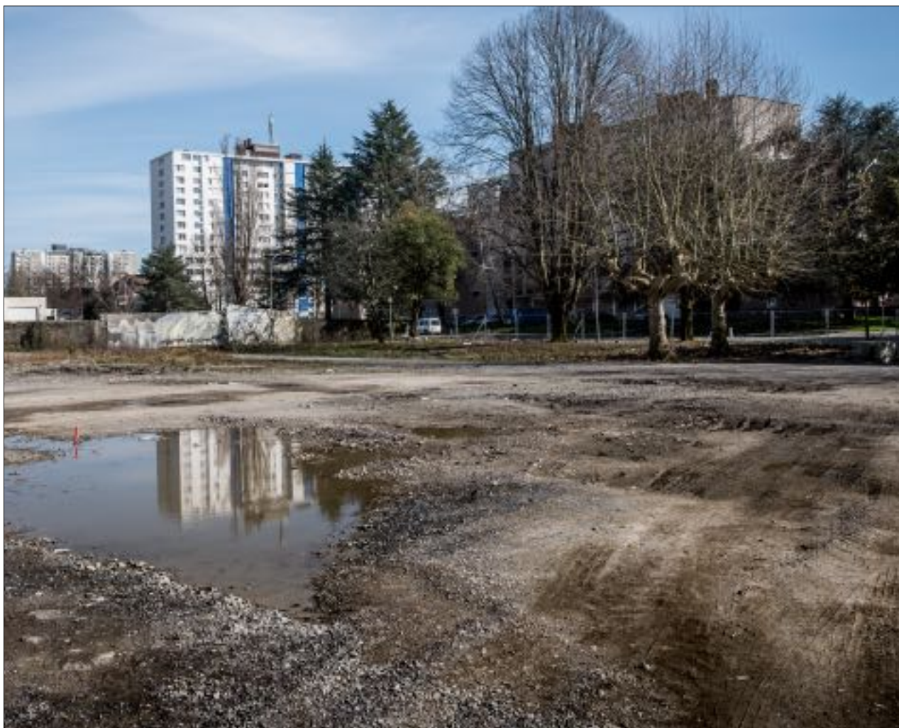
La friche Laherrère du quartier Saragosse